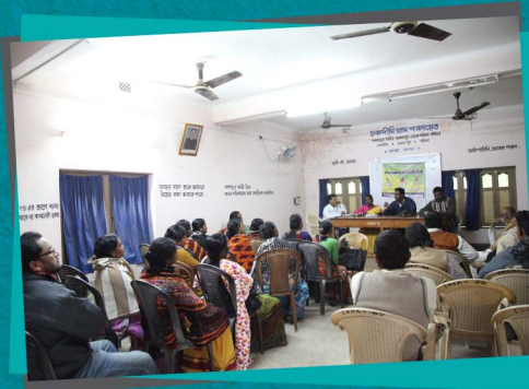
Designing and Printing by Span Communications

দল, মত, জাতি, গোষ্ঠী, নারী, পুরুষ নির্বিশেষে এলাকার সকল মানুষের গ্রাম সংসদ সভায় উপস্থিত থাকা প্রয়োজন। নিজেদের সমস্যা ও চাহিদার কথা জানানো এবং গ্রাম পঞ্চায়েতের দ্বারা সংগঠিত সমস্ত কাজের হিসাব জানার জন্য গ্রাম সংসদ সভায় অংশগ্রহণ একান্ত জরুরি। এই সভা যেমন পঞ্চায়েতকে জনমুখী করে তোলে, তেমনই জনগণকেও করে তোলে পঞ্চায়েতমুখী।